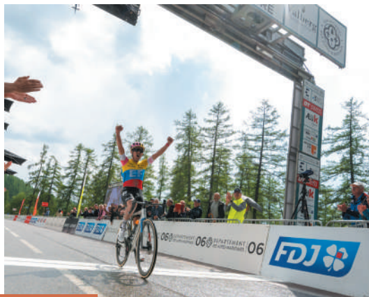
Richard Carapaz, Vainqueur de la MTCAM 2023

Stand avec animations ouvert au grand public en partenariat avec l'Assemblée des Départements de France.