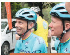
Alexandre Vinokourov au col de Valberg en 2022

Bien que le dispositif fonctionne 24h/24, le Département organise chaque année une journée de convivialité sur chaque sommet afin de faire découvrir ces cols azurés mythiques. Des personnalités du sport participent à ces rassemblements comme la légende du cyclisme sur route Stephen Roche, le champion olympique Alexandre Vinokourov ou encore le champion du monde d'athlétisme Stéphane Diagana.