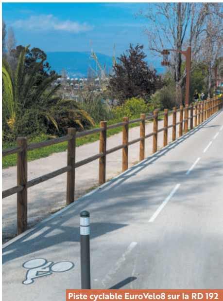
Piste cyclable EuroVelo8 sur la RD 192 Mandelieu-La Napoule

En termes d'équipements cyclables, le Département des Alpes-Maritimes met à la disposition des cyclistes près de 700 arceaux vélos, 104 stations de gonflage et réparation, 7 boxes à vélo ouverts au public et 13 bornes de recharge VAE (vélos à assistance électrique).